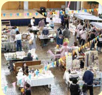
▲ゆめりあマルシェの様子(ゆめりあ自主事業)

外からの光が感じられるガラス張りの広場。イベント会場や音楽ステージなど交流活動の場として最適です。また、多くの人から休憩や待合所としてご利用いただいています。